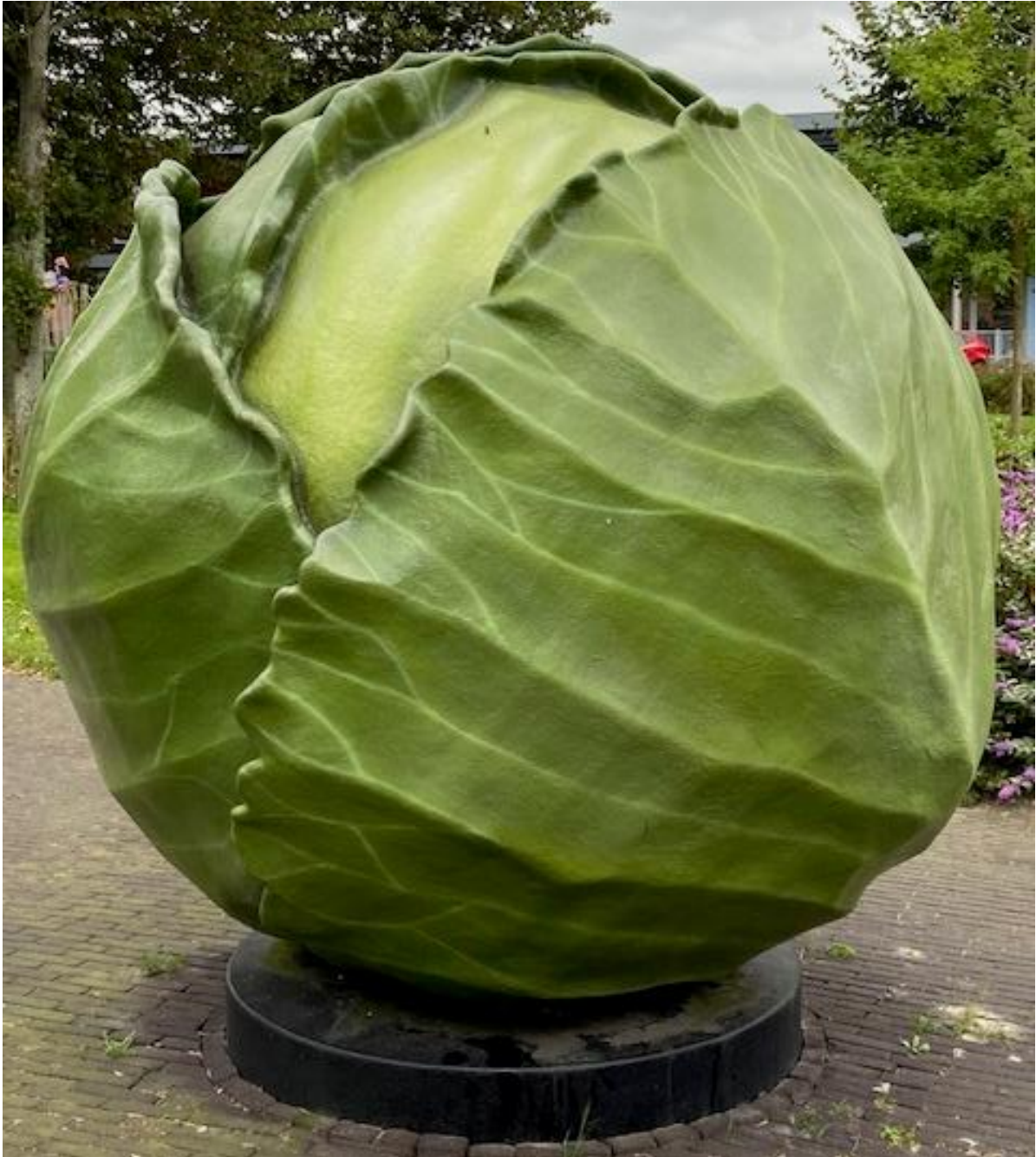
Kunst of kool.