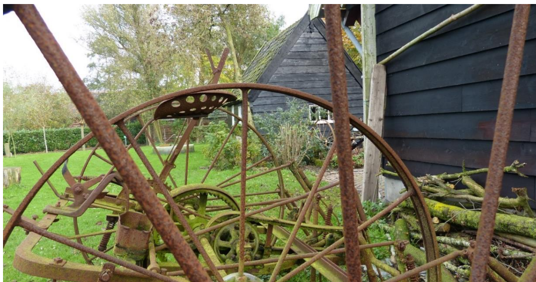
Ergens achter het museum, vooraan in de tuin, veel hout en roestig metaal... Aaneengeschakelde museumstukken.

Toen ik een kleine 40 jaar terug de schrijvers- en uitgeverwereld verkende en uiteindelijk aan het schrijven en uitgeven begon, heb ik me eerst goed in de materie verdiept. Zo kwam ik erachter dat je in zo'n inleidend stuk het beste een actueel onderwerp ter hand (lees: ter pen of pc) kunt nemen. En dat doe ik al jaren. Iets wat me kort daarvoor is opgevallen. Maar ik kan natuurlijk niet elke keer iets over de nu al maanden achtereen aanhoudende regen gaan schrijven, of over het feit dat nu in juni er nog zo weinig koeien buiten lopen. Of over het gemis aan de aan bij het museum betrokken personen gevraagde bijdragen. Er moet wel iets gebeurd zijn waarover geschreven kan worden. Iets dat een beetje interessant is. En ook dat kan door de lezer anders worden ervaren dan door de schrijver is bedoeld.