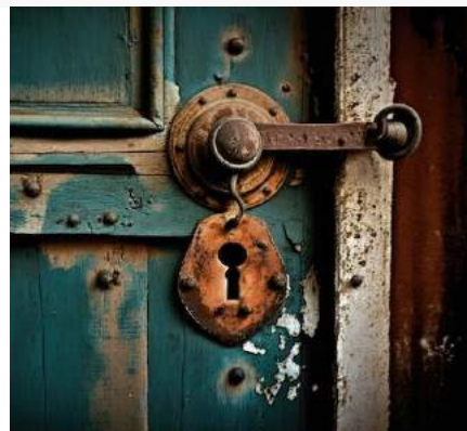
Deuren zijn er in allerlei soorten en maten. En dan heb je nog een grote diversiteit aan deurbeslag, ook in soorten en maten.