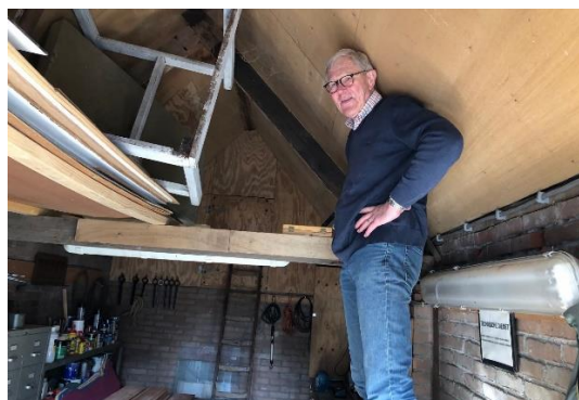
De tuintafels worden opgezocht.