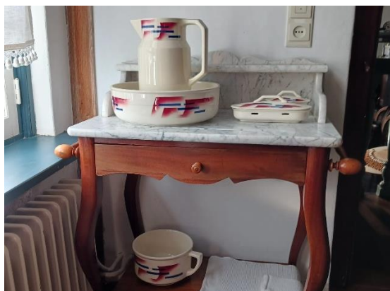
Een geschonken lampetstel.