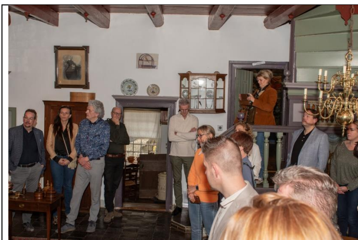
De Ondernemersvereniging van Hardinxveld-Giessendam brengt en werkbezoek aan Museum De Koperen Knop.