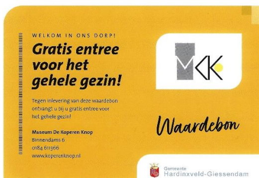
Alle nieuwe inwoners van Hardinxveld-Giessendam, krijgen van de gemeente een welkomstpakket, met deze kaart.