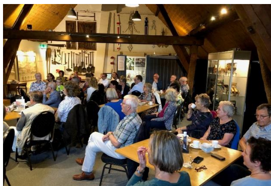
Een boekpresentatie op De Etage.