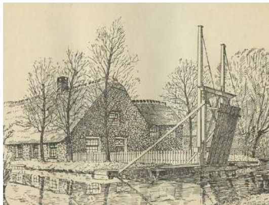
Een van de tekeningen van Van der Kloot Meijburg, hier van een boerderij in Stompwijk

De welvaart was gegroeid, zelfs op het platteland, en boeren konden zich veroorloven om hun huizen te verfraaien: ze wilden niets liever. Ze sloopten ze en zetten mooie nieuwe neer, bouwden moderne schuren of brachten versieringen aan, engelenramen bijvoorbeeld. In de graangebieden in het noorden van Groningen waren rijke boeren die kasten van huizen lieten neerzetten in deftige stadse vormen, met pilasters en stucwerk, waarmee ze konden tonen dat ze niet zomaar uit de klei waren getrokken, maar welvarende, respectabele heren waren. Mooimakerij, weeldevertoon, jawel, graag zelfs.