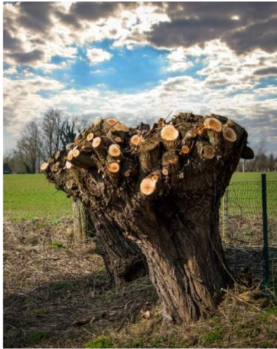
In de natuur.

De winter, de rustige tijd van het jaar, was een mooie tijd voor zulk soort klussen op en om het erf. Nuttige bomen, die knotwilgen. Van onmisbare waarde. Verweven met het boerenbestaan van vroeger. Maar ook al maakt de moderne boer zelf geen hekken, bezemstelen of klompen meer van wilgenhout, daarmee is de wilg niet overbodig geworden. Een onlosmakelijk en onmisbaar onderdeel van ons veenweidelandschap zoals dat al honderden jaren bestaat. Belangrijk voor flora en fauna. De aandacht van een museum waard. Opdat de knotwilg geen stoffig museumstuk wordt.