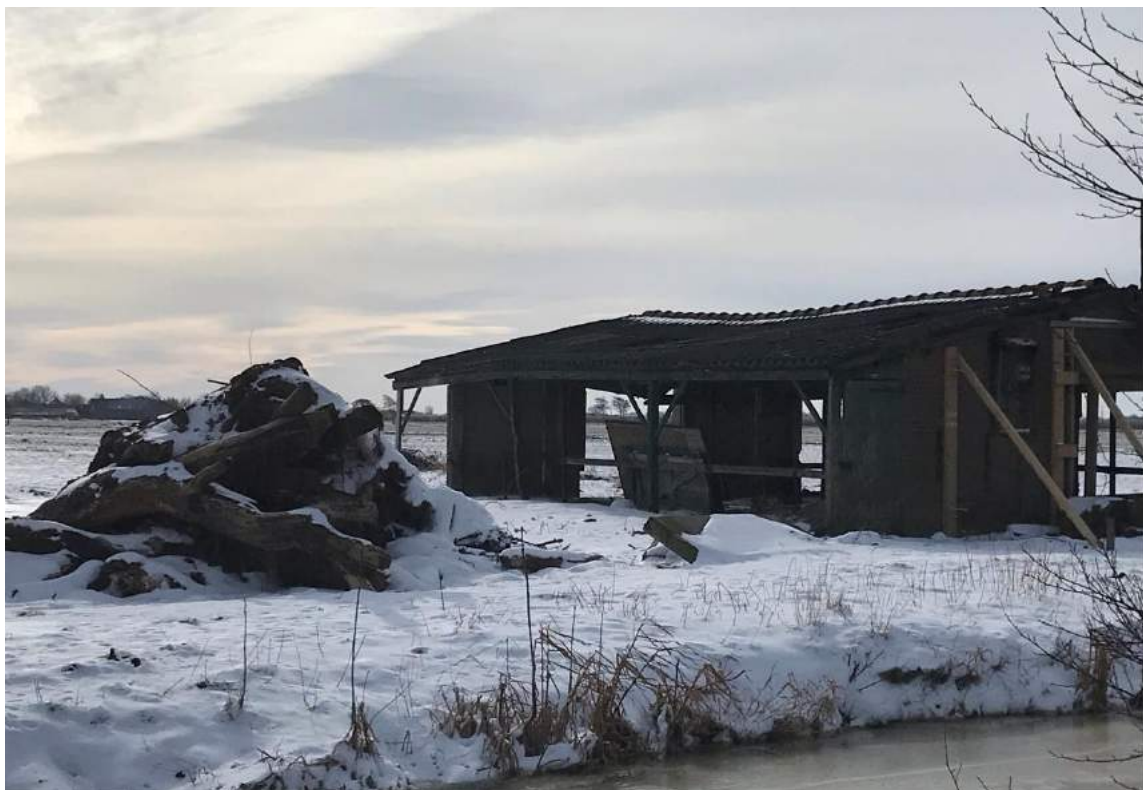
Een verstillid winterlandschap in Hoornaar.