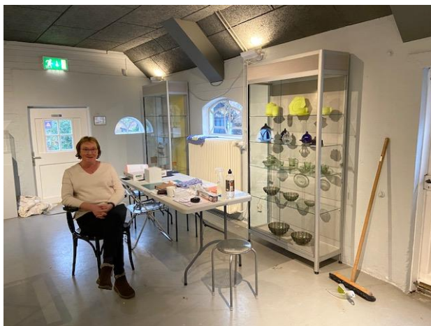
Even uitblazen tijdens het inrichten...

Deze expositie toont een mooie greep uit het aanbod van Nederlands persglas. Naast persglas uit onze eigen collectie worden stukken getoond van de collectie van Glasmuseum Leerdam en stukken van particuliere verzamelaars.