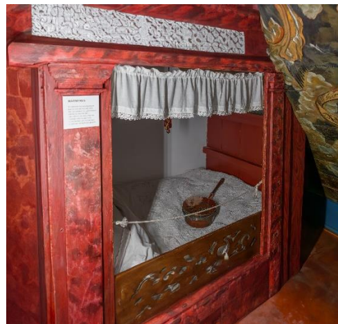
Bedstee in de opkamer.