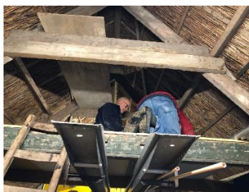
Uit de hanenbalken van de lange schuur kwam heel wat tevoorschijn.