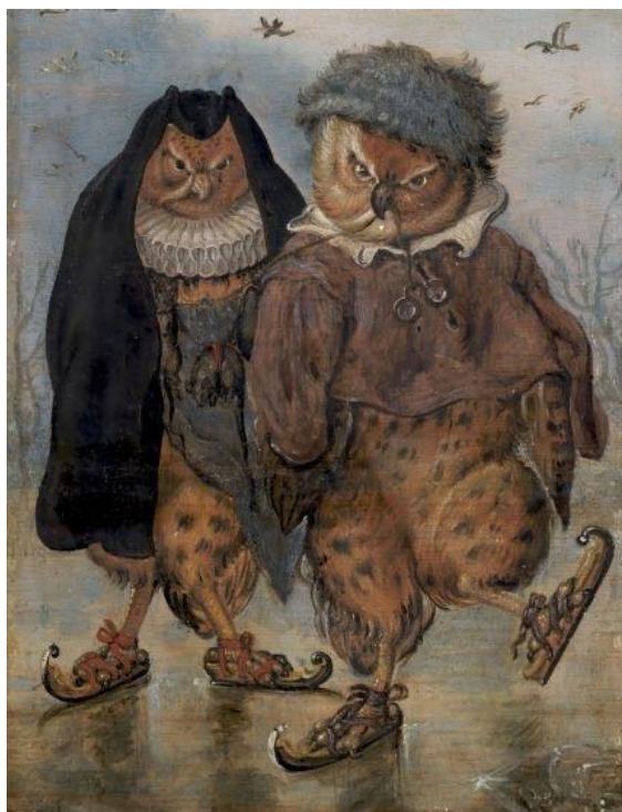
Schilderij Hoe passen wy by een - Adriaen van der Venne.