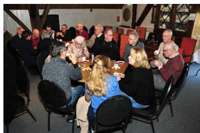
Tijdens de druk bezochte nieuwjaarsbijeenkomst voor de vrijwilligers.

Op dit moment zijn we 2024 ingegaan. Dat gebeurde in een bijzondere tijd. Een tijd van uitersten. Velen hebben de verkiezingsuitslagen van het afgelopen najaar nog in het geheugen en bijna evenveel mensen vragen zich het waarom hiervan af. Dan gaat het nadrukkelijk niet om er een oordeel over te geven, maar gaat het om het feit. Hoe kan het bestaan dat in een welvarend land als Nederland zich zo'n omslag voordoet. Gelukkig zijn er ook zaken die gewoon blijven. Die wel aan veranderingen onderhevig zijn, maar op een rustige manier. Zo hopen we in De Koperen Knop in 2024 mee te maken dat we 35 jaar bestaan. Dat we kunnen terugzien op 35 jaar groei is mooi. En iets om trots op te zijn. Apetrots! Laten we er met elkaar opnieuw de schouders onder zetten. We zijn met elkaar in staat om iets moois te bereiken.