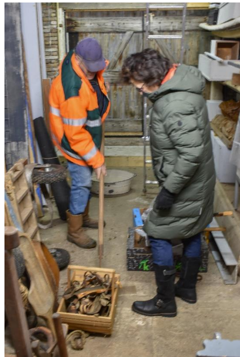
Binnengekomen schenkingen worden bekeken voor ze een plek in het museum krijgen.

Iedereen die ook graag wil worden opgenomen in het mooie team wordt uitgenodigd om eens vrijblijvend te komen praten. Maak een afspraak door te bellen met 0184-611366.