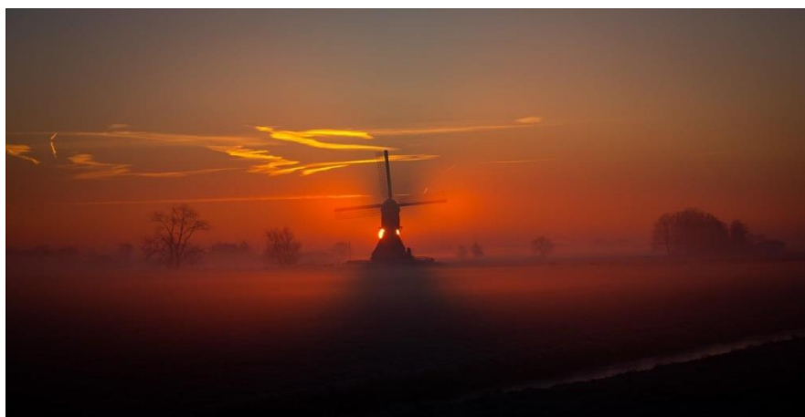
Kleine Molen Streefkerk

Met de restauratie heeft de Oostmolen weer Busselneuzen. Dit is een verbeterd wieksysteem met gestroomlijnde neuzen aan de roeden. In de periode 1943 - 1982 heeft de molen ook dit wieksysteem gehad. Met de restauratie in 1982 zijn de Busselneuzen vervangen door het normale oud-Hollandse systeem met houten borden. Toen was het idee dat je 2 verschillende wieksystemen kon zien, Busselneuzen bij de Westmolen en de houten borden bij de Oostmolen. Met de huidige restauratie is vooral gekeken naar de historische context dat bepalend was voor het type wieksysteem. De Oostmolen was tot ongeveer 1971 voor de polder in bedrijf. Omdat de molen op dat moment Busselneuzen had, is dat een belangrijke historische gegeven. De molen is ook geschilderd zodat de molen na deze omvangrijke restauratie er weer prachtig bij staat.