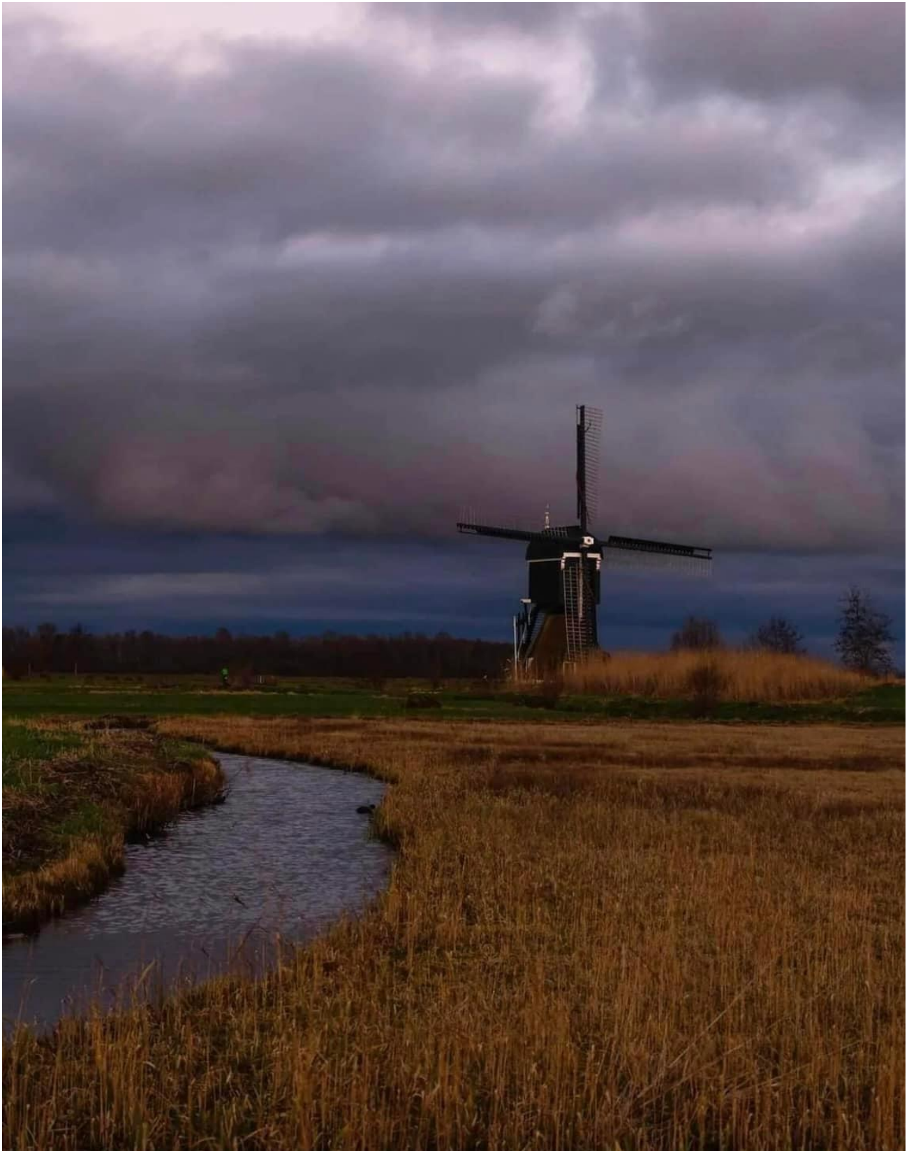
Broekmolen Streefkerk