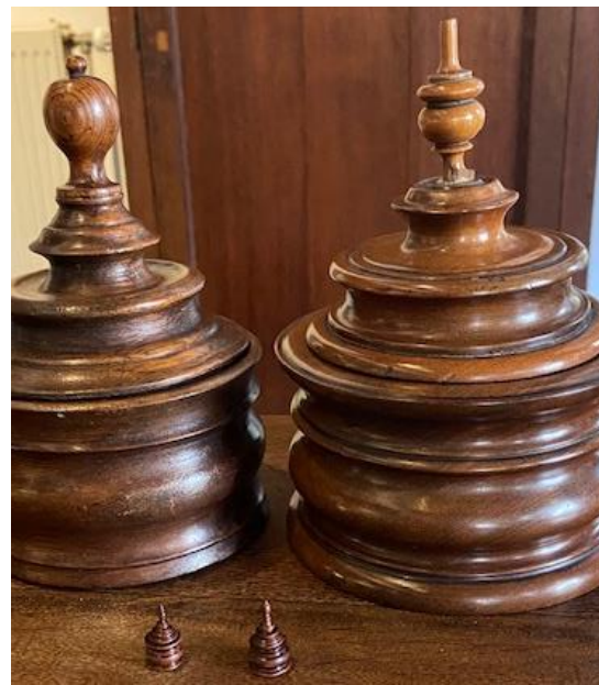
Twee tabakspotten uit de museumcollectie in het klein.