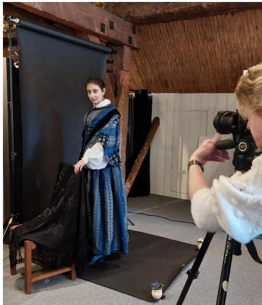
Opnamen voor de komende najaarsexpositie.

En ze mogen dan meer dan honderd jaar oud zijn, uit de tijd vindt hij ze niet. „Ik denk dat ze ons een spiegel voorhouden. Vooral de bébés multiples laten zien hoe we van het leven kunnen genieten, door er alles uit te halen wat erin zit.”