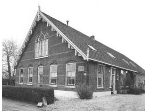
Steen op gevel van Beijerscheweg 69-71 uit 1900.

langs de Beijerscheweg, Zuidbroek, Achterbroek, Benedenkerk en Bovenkerk zijn alle vrij jong. De meeste zijn van na 1850. Veel boerderijen hebben een gevelsteen in voor- of zijgevel waarin het bouwjaar gehakt staat. Vanaf het midden van de 19 e eeuw komen die stenen voor. Een enkele boerderij is door bakstenen in het metselwerk gedateerd (Haastrecht Provinciale weg Oost 15 uit 1658).