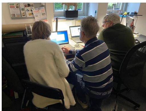
Even technisch overleggen...