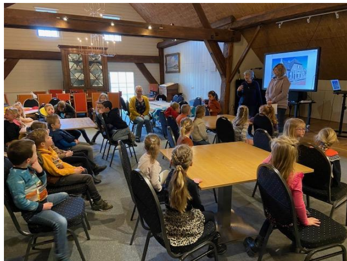
Een educatieve les.