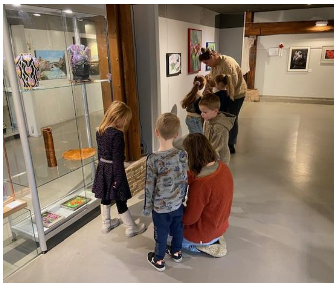
Leuk: een bezoek aan een museum...