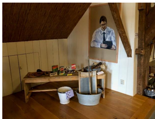
Een collectie schoonmaakspullen: 'het is voorjaar'!