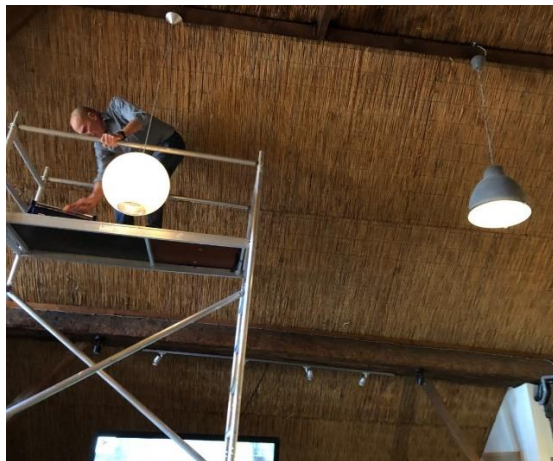
Nieuwe lampen voor De Etage.