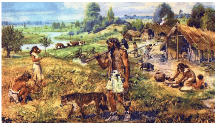
Hier is al sprake van een gecombineerde jager-verzamelaar en boerenfunctie.

Voordat de moderne mens, de homo sapiens, in Europa arriveert, zo'n 45.000 jaar geleden, wonen er ook al mensensoorten. Bijvoorbeeld de Neanderthalers, die leven in de periode die we de oude steentijd noemen, vanaf 300.000 jaar geleden. Ze wonen hier in een uitgestrekt steppeachtig landschap met rivieren en valleien, dat nauwelijks begroeid is. Het niveau van de Noordzee staat veel lager dan nu en in de koudste perioden ligt hij droog. De Neanderthalers leven in hutten en kunnen vuur maken.