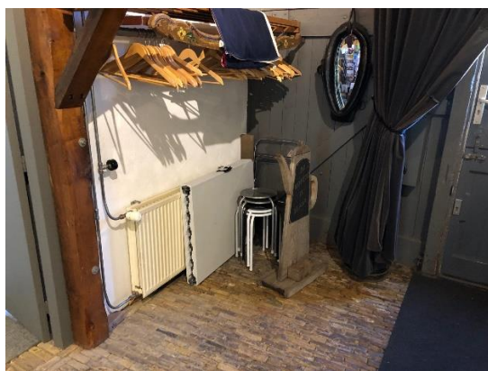
Na elke wisseling van exposities blijft er overal van alles staan. Wie ruimt het op?