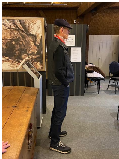
Het wakend oog van de meester bij een van de schoolgroepen.