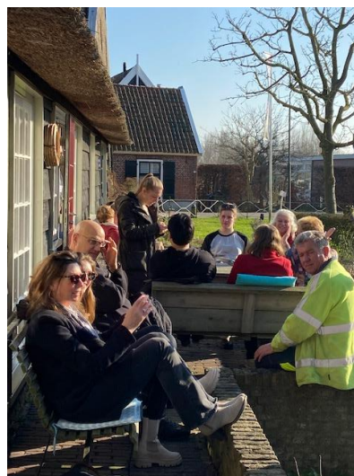
De eerste keer dat dit jaar het terras bezet was: tijdens eden excursie rit van de Gemeente Hardinxveld-Giessendam.