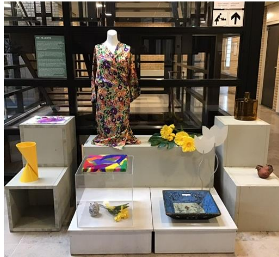
▲ De opstelling van het expositieonderdeel in de hal van het gemeentehuis van Hardinxveld-Giessendam