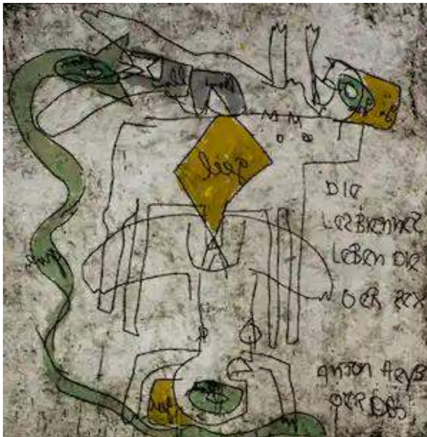
Anton Heyboer. Schilderij, getiteld: Hij kocht een stuk land met een koeienstal. Hij noemd een reeks schilderijen naar Zijn aankoop van een voormalige boerderij ergens boven Amsterdam.