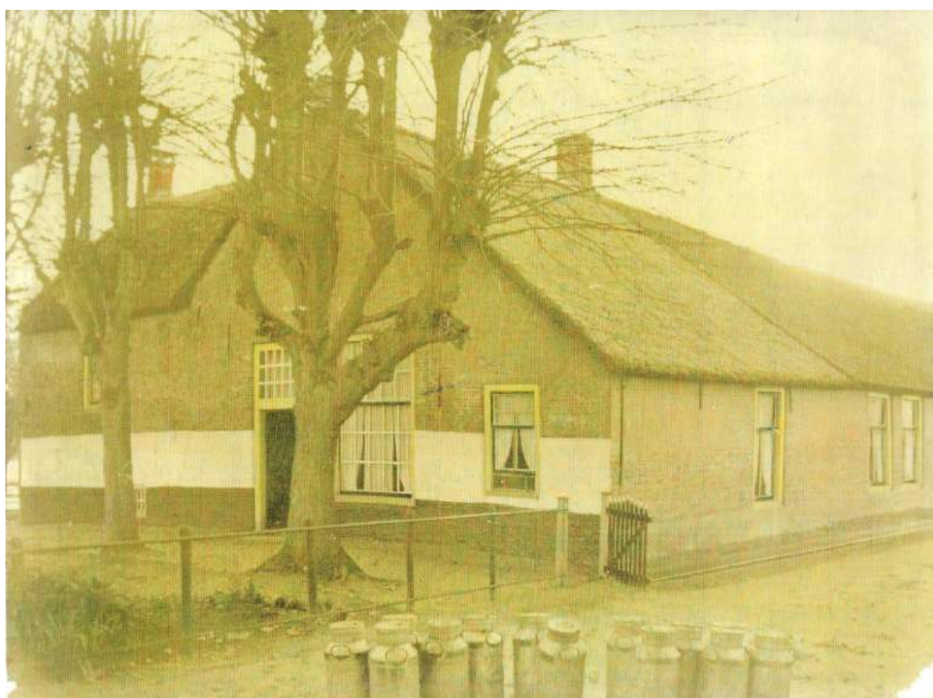
Een door de ouderdom vergeelde foto van een typische boerderij uit de streek.