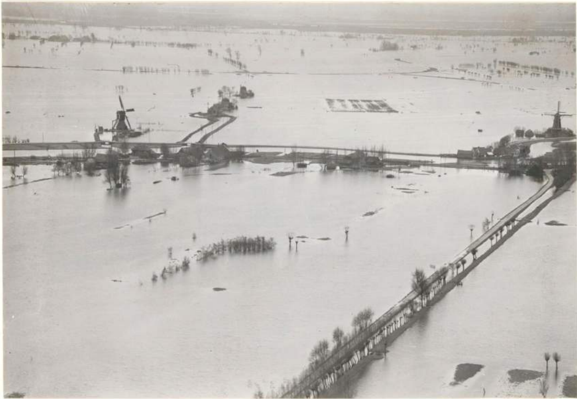
Luchtfoto van een in 1953 ondergelopen stuk van de Alblasserwaard.