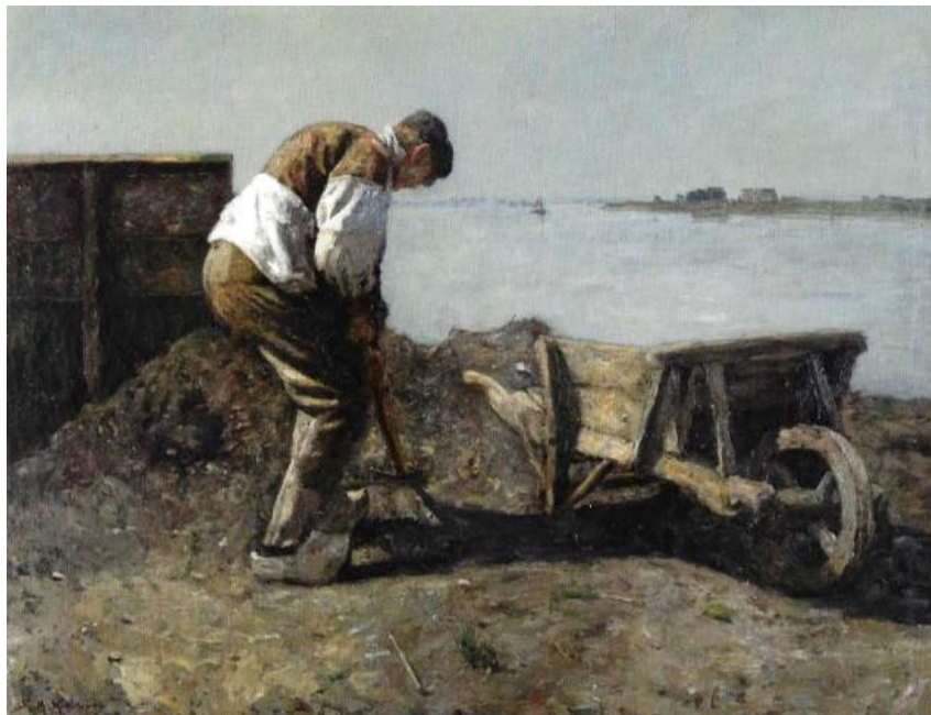
De Dagloner. schilderij van Bernard Koldewij ± 1890. Dordrechts Museum

Vanaf het ontstaan van de eerste boeren ten tijde van de neolitische revolutie (overgang van jager-verzamelaars naar boeren) waren er landarbeiders in de vorm van familieleden en knechten die de boer bijstonden in zijn lichamelijke arbeid.