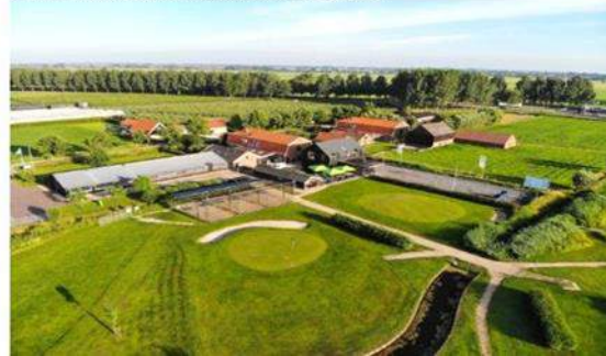
Herbestemming Maria Johanna Hoeve Noordeloos