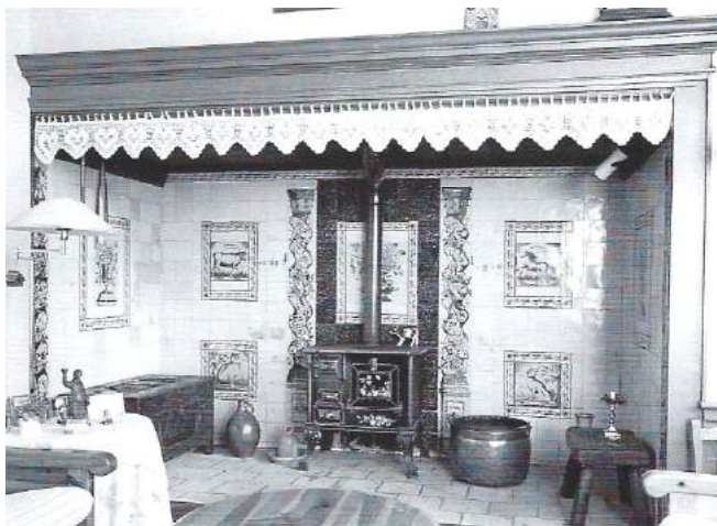
Schouw in de boerderij Provinciale weg West 23A te Haastrecht uit de late 18 e eeuw. In het midden zit de roetbaan met een bloementableau, die door pilasters wordt geflankeerd. De omlijste blauwe tegeltableaus te weerszijden zijn later ingebracht (foto 1994).

Tegels konden zowel een decoratieve als een didactische waarde hebben, het laatste met name wanneer de tegels met Bijbelse voorstellingen beschilderd waren. De toepassing van tegels in de interieurs was overigens niet beperkt tot de schouwvanden. Men vindt ze ook terug in de plinten en - in mindere mate - overige muurvlakken. Dit had mede een bouwkundige reden: door het optrekkend vocht smetten de muren. Het aanbrengen van tegels op plinten en tegen muur- vlakken was de aangewezen oplossing. De mate en aard van toepassing van de tegels hing samen met de ter beschikking staande ruimte.