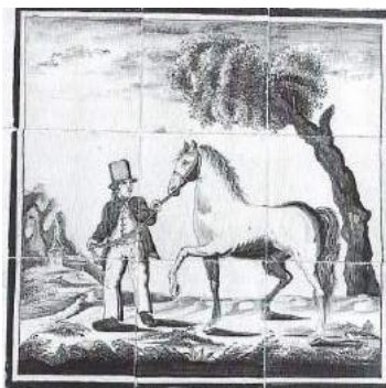
Tableaus uit de 19 e eeuw met een landman met koe en een landman met paard. Deze bevinden zich aan weestkanten van de schouw Oost Vlisterdijk 5

Uit: Catharina L. van Groningen: De Krimpenerwaard (Zwolle 1995).