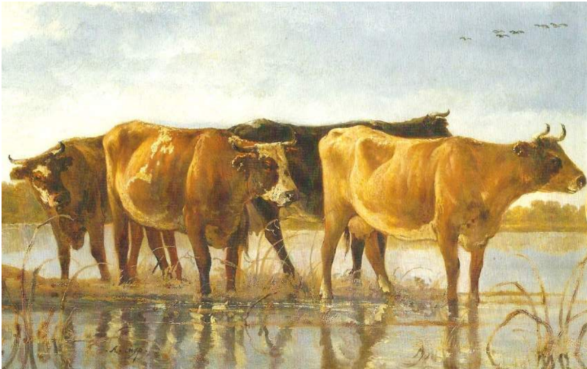
Detail van een schilderij van Aelbert Cuyp, waarvan momenteel een expositie te zien is in het Dordrechts Museum.