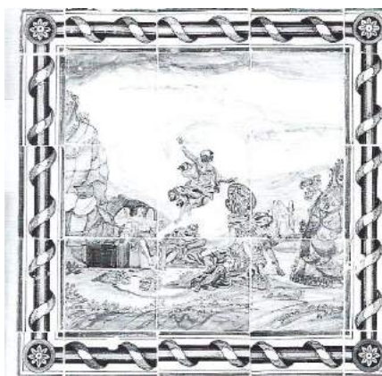
Tableau met verrijzenis van Christus in Beijerscheweg 75 Stolwijk (foto 1977).

De boezem wordt lager en smaller. Op en naast de boezem verschijnen forse tableaus die met een sierrand in de vorm van een koord of bloem- en bladwerk worden omlijst. De tableaus vertonen scènes uit het dagelijks boerenleven - rivierlandschap met koeien en boerderijen - of thema's uit het Oude en Nieuwe Testament. In diverse boerderijen in Haastrecht en Vlist vindt men aan de schouwen een Lopikerwaardse variant: hier zijn de hoeken van de schouwboezem met een koperen strip afgewerkt.