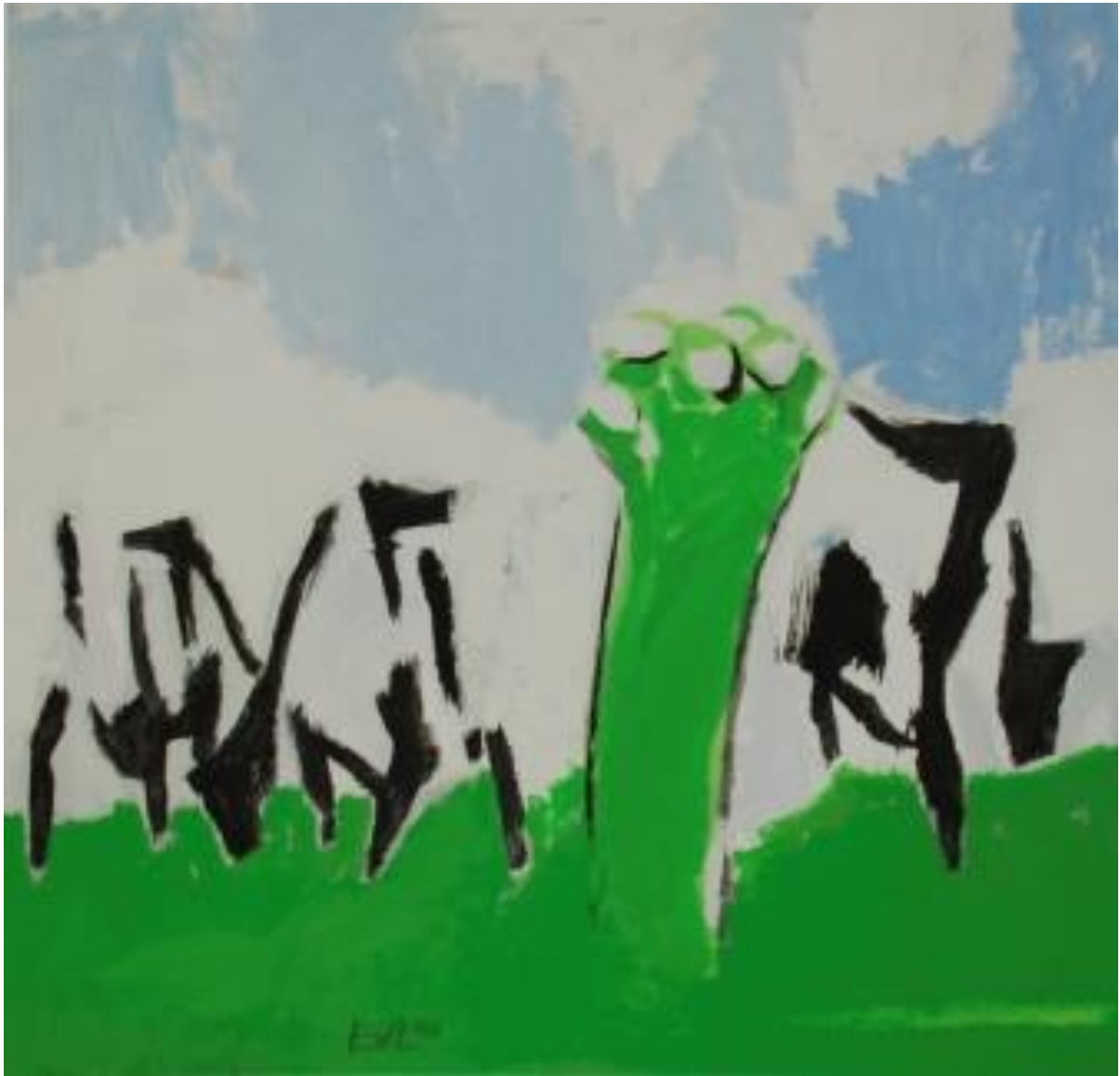
▲ Schilderij 'Knotwilg met koeien' van Evert van Lopik.

Hardinxveld-Giessendam 21.07.2021 - Dick de Jong