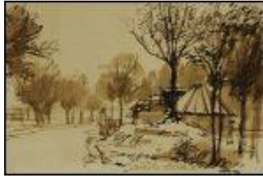
▲ Otto Dicke: Oud-Alblas