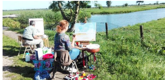
▲ Lekker schilderen of tekenen in de buitenlucht.

Creatieve workshops in en over het landschap, met ter afsluiting een (korte) expositie van het werk, in instellingen en/of Museum De Koperen Knop. Er worden uiteenlopende workshops voorbereid zodat iedereen kan meedoen. Ze worden buiten gepland, maar bij minder goed weer kan het ook binnen. Geheel verzorgde dagen (09.00-17.00), waarbij consumpties en lunch zijn inbegrepen. Gedacht wordt aan najaar 2021 en voorjaar 2022.