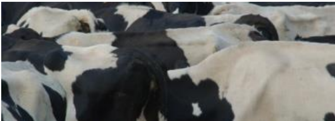
▲ Een typisch beeld in het veenweidelandschap van de Alblasserwaard-Vijfheerenlanden: openstaande koeien.