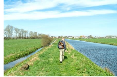
▲ Wandelen langs de Boezem.