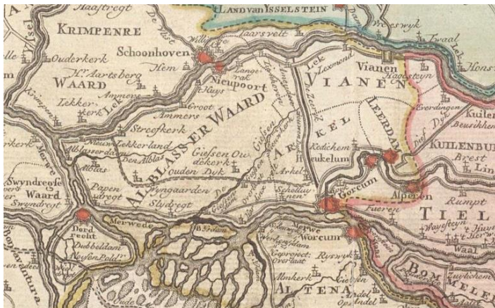
◀ Kaart van de rivierenloop van de Rijn, de Maas, de Waal, de Merwede en de Lek... Detail van een kaart uit de Handatlas van Isaak Tirion (18 e eeuw).