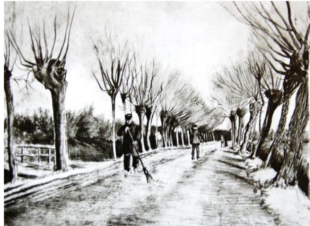
▲ Tekening met de knotwilgen als lanenboom.