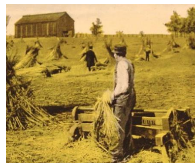
▲ Hennep werd vroeger veel verbouwd voor touw voor de zeescheepvaart..

De expositie, onderdeel van het reguliere expositieprogramma (en daardoor verzorgd door de expositiecommissie), is goed bezocht en de reacties van het publiek waren bovengemiddeld.