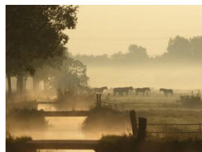
▲ Paarden in de wei - Kweldamweg.