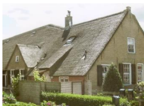
▲ Boerderijen, iconen in de streek - foto: A.F. van Houwelingen.

Groen Verbindt komt voort uit het bereiken van doelen uit de Beleidsvisie Groen. Bedoeld voor b evordering van g roenbeleving en v ergroting van r ecreatie. En passant wordt ook het doel a grarisch o ndernemerschap meegenomen. De opdracht is: het unieke landschap van de Alblasserwaard-Vijfheerenlanden goed in beeld krijgen bij een breed publiek, overheden, ondernemers en particulieren. Eerst is een bijdrage van 25% van de kosten toegekend, met cofinanciering, grotendeels bestaand uit vrijwilligerssuren. Later is de bijdrage verhoogd naar 50% en heeft de Gemeente Molenlanden een extra bijdrage van € 7.500 toegekend (Fonds Plattelandsontwikkeling), wat het totale budget bepaalt.