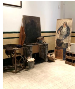
▲ Collage van een smid, eveneens in het Wisboomgemaal.