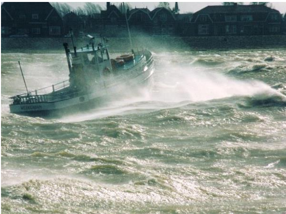
▲ Veerpont Boven-Hardinxveld - Werkendam in de storm.

De fotowedstrijd in fase 1 was een groot succes. Dus is herhaling aanlokkelijk. Ook nu weer in samenwerking met Museum De Koperen Knop waar alle inzendingen digitaal getoond kunnen worden. Het onderwerp vergt een looptijd van een jaar zodat alle seizoenen en weersomstandigheden 'meegenomen' kunnen worden. In het museum komt in het najaar van 2022 een expositie (zie volgend punt), waar de foto's op aansluiten. De wedstrijd gaat aan de expositie vooraf. Een vakjury en een publieksjury bepalen samen de winnaars, die aantrekkelijke prijzen krijgen. Mogelijk kunnen er ook selecties uit de inzendingen worden getoond in instellingen; iets waar mee het museum ervaring heeft.