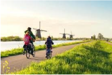
▲ Fietsen langs de Ammerse Kade.