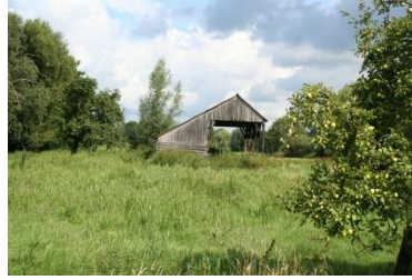
▲ Verrassende landschapselementen.