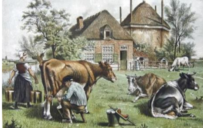
▲ Schoolplaat van het melken.