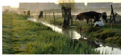
▲ Woningbouw bedreigt de veeteelt.