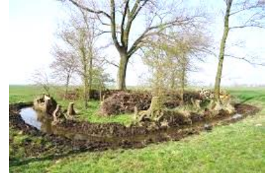
▲ Onbekende zaken in het landschap.