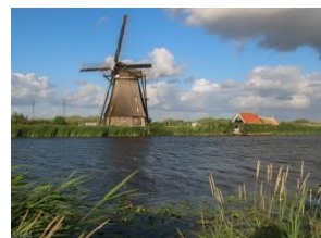
▲ Overall water- en andere molens - foto Ilse de Deugd.