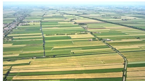
De Alblasserwaard op een luchtfoto uit de Polderatlas van Nederland. ▼