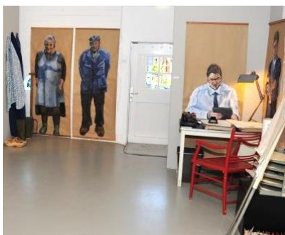
▲ De ruilverkaveling met een uitbeelding van oud en nieuw.