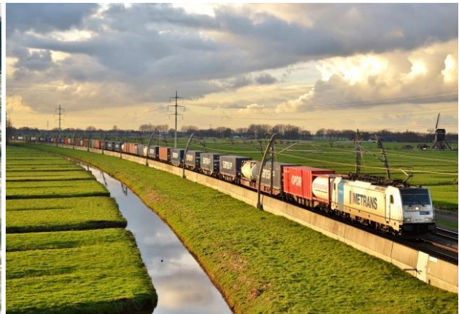
▲ Wolkenluchten boven de Betuweroute.