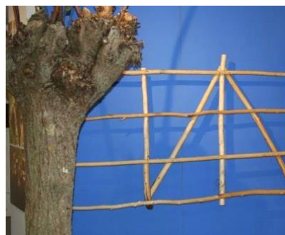
▲ De knotwilg en een belangrijk daarvan afkomstig product.