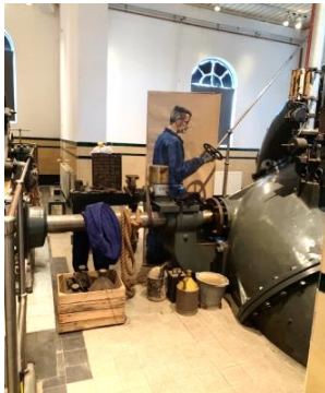
▲ Collage van een machinist in het Wisboomgemaal in Kinderdijk.

Gedurende de looptijd is met regelmaat de pers geïnformeerd, wat heeft geleid tot meer bekendheid met en een groeiende interesse voor het unieke karakter van het veenweidelandschap in het gebied.