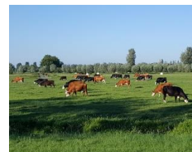
▲ Koeien In het veenweidelandschap.