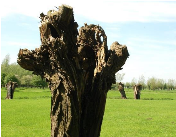
▲ Een sieraad in het landschap.