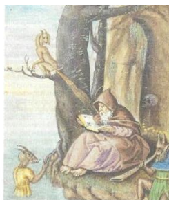
Thuiswerken is niet alleen iets van deze nieuwe tijd...

INLEIDING Over vier weken is het al weer een nieuw jaar. Zo'n overgang van het oude naar het nieuwe jaar is altijd een geïk moment om terug te kijken naar wat achter ons ligt. Zeker nu, in deze coronatijd. Tegelijkertijd kijken we vooruit, omdat we ook in 2021 nog volop met dit probleem te maken gaan krijgen. Je hoort nogal eens gemopper over corona en de gevolgen. Anderen berusten er in en pakken de zaken op zoals dat kan. Dit laatste is mogelijk omdat we in Nederland in zo'n geweldige welvaart leven. Het is goed om daar eens bij stil te staan. Maar ook, dat die welvaart niet voor iedereen in het land geldt.