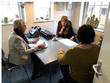
Even overleg... op gepaste afstand.

het project 'De Digitale Collectie': € 944,10 uit de actie Rabo Club Support. Deze week kwam een toezegging van het Prins Bernhard Cultuurfonds Zuid-Holland van € 6.000 voor dit project. Een aanvraag bij het Rivierenlandfonds is de deur uit.