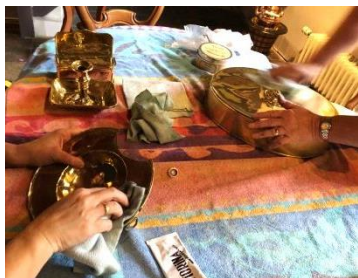
Het koper poetsen gaat gewoon door.