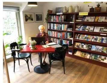
Tijdelijke werkplek in museumcafé.