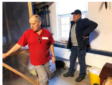
Nieuwe rekken voor het depot.