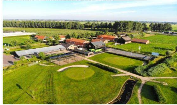
Herbestemming Maria Johanna Hoeve Noorderloos