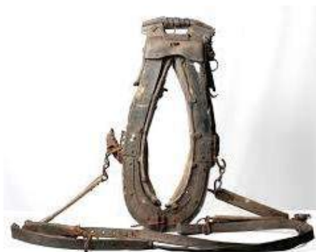
Het gebruik van de haam was een hele vooruitgang in de landbouw.

halsjuk. Door dit op de hals van een paard te zetten werd het voor de boer mogelijk om niet alleen zwaarder en grootster werk uit te voeren, maar het ging ook veel sneller dan met ossen. De invoering ervan duurde echter eeuwen en in sommige Europese landen (Oost-Europa en Ierland) is de os tot ver in de 20 e eeuw het belangrijkste trekdier gebleven.