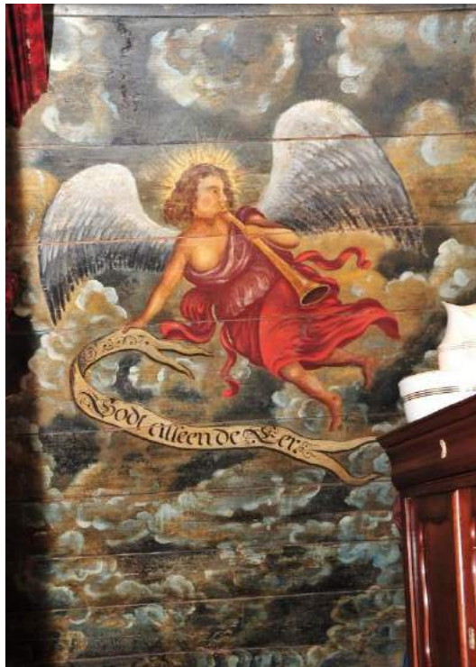
Plafondschildering in de opkamer van Museum De Koperen Knop, die begin jaren zeventig van de vorige eeuw is terug gerestaureerd.