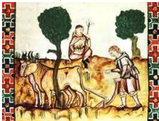
Met een span ossen...

Het is boeiend om in het boek waar bovenstaande informatie uit komt ook te lezen dat er in de vroege middeleeuwen al sprake was van een goede taakverdeling tussen de boer en de boerin. Toen al was de boer bezig met alles van het boerenbedrijf en de vrouw meer met de behuizing. Nog steeds komt het voor dat de boer zich meer bezighoudt met de stal en alles er achter en de vrouw met 'voor', zoals alles rondom de boerenwoning wel wordt uitgedrukt.