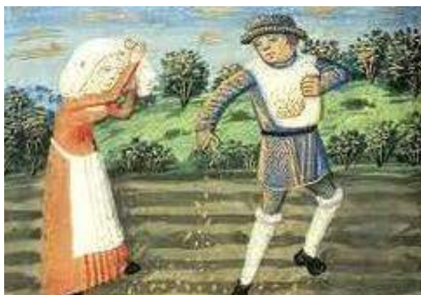
Zaaien in de middeleeuwen

Het grootste deel van de landbouw bleef bij het oude. Alles gebeurde, zoals het al eeuwen gebeurde. De beperkte vernieuwingen die er waren sijnelden maar langzaam door. Meestal vergde zo'n verandering vele jaren en ging eigenlijk onmerkbaar voort. In een enkel geval in confrontatie met hardnekkig conservatief boerenverzet. Goede ideeën en nieuwe uitvindingen lagen in die tijd soms eeuwen in de week alvorens ze werden opgepikt. Ze werden gewoonweg niet gezien.