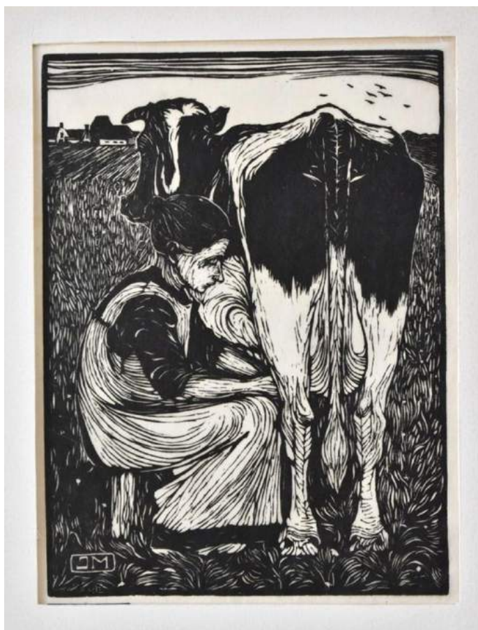
Jan Mankes (1889-1920)

Je hoort ze snuiven, lopend in het grijze natte gras, dan daar in de verte maar ook toch weer dichtbij.