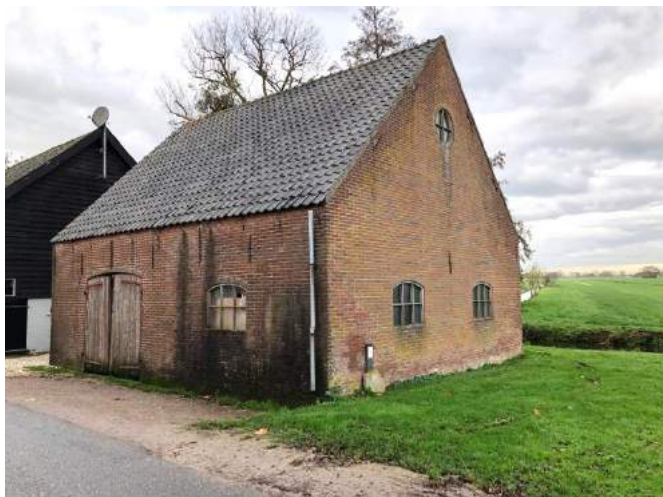
Tegenover Pinkeveer in Giessenburg

Door de gevolgen van Covid-19 zijn zowel de voorjaarsvergadering voor begunstigers en de excursie in het najaar geannuleerd. Omdat naar verwachting ook het komende voorjaar nog weinig van samenkomsten te realiseren valt is besloten de halfjaarlijkse printversie van Boer & Hoeve in 2021 qua tijd naar voren te halen, zodat betrokkenen toch worden geïnformeerd over de voortgang en het reilen en zeilen van de stichting.