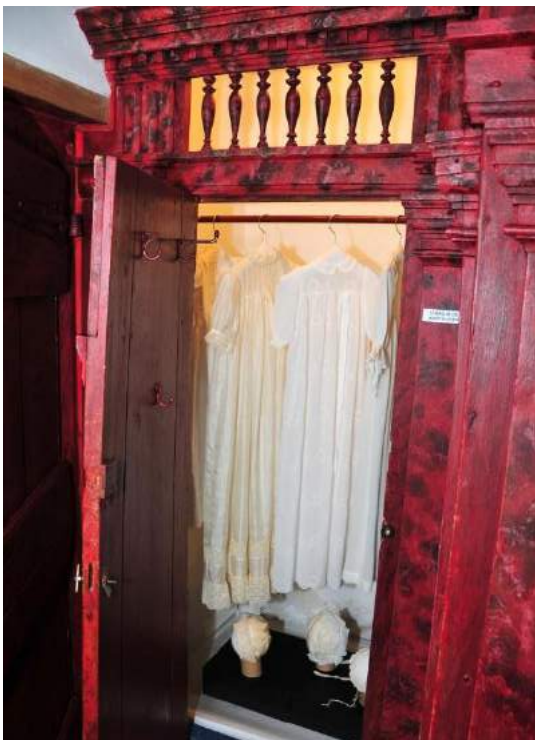
Beschilderde kastwand in Museum De Koperen Knop. In het midden van de openstaande deur (hier niet te zien) bevindt zich een geschilderd kinderhoofdje.

terecht gekomen of heeft de witkwas ze aan het zicht ontnomen. Gelukkig komen er steeds meer technieken om dit soort unieke cultuurhistorisch waardevolle elementen terug te restaureren. Van oudsher worden houten onderdelen in interieurs beschilderd. Denk aan schilderingen op plafonds, vloeren, lambriserings, deuren, schouwen, luiken, kasten en bedsteden. Wanneer interieurschilderingen beschadigd zijn, is herstel vaak goed mogelijk en zijn ze de moeite waard om te behouden. In een geval heeft de Stichting Boerderij & Erf ervoor gezorgd dat een plafondschilderingen terugkwam in een boerderij, maar die is met een grote brand van dat pand weer teniet gedaan.