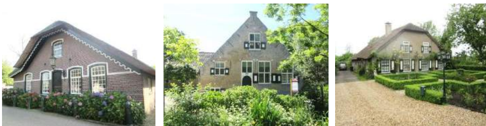
Boerderijen in de Krimpenerwaard

De laatste vijftig jaar is de aard van het boerenbedrijf sterk veranderd. Om de ontwikkelingen in de agrarische sector bij te houden vonden in een snel tempo wijzigingen, verbouwingen en uitbreidingen plaats die over het algemeen geen rekening gehouden hebben met de historische waarde van oude constructies. Daarnaast is een groot aantal bedrijven inmiddels aan een agrarische functie onttrokken. In plaats van een boerderij met haar duidelijk afgebakende woon- en werkfuncties ziet men een gebouw dat door de nieuwe bewoners geheel tot woonhuis is ingericht. Bedrijfsruimtes als kaaskamers en spoelruimtes, melkkelders, stal en tas had men niet meer nodig. Men paste ze aan aan de eisen van modern wooncomfort. Soms met gevoel en terughoudendheid, vaker echter op tamelijk rigoureuze wijze, zodat alleen de gebinten in de voormalige stal nog indicaties geven over de oude indeling. Een ander probleem waarmee wij werden geconfronteerd is dat bij sommige restauraties een boerderij zodanig 'oud' gemaakt werd dat de leek niet meer kan onderscheiden wat er nu oorspronkelijk tot de boerderij behoorde en wat aan het brein van de restaurerende eigenaar of architect is ontsproten. Schouwen werden bijgemaakt of verplaatst, tegeltableaus van elders werden ingebracht, balklagen omgedraaid, 17de-eeuwse consoles en korbelen bijgemaakt. Restauraties kunnen zo op verschillende manieren desastreuze gevolgen hebben voor de geschiedenis van een gebouw.