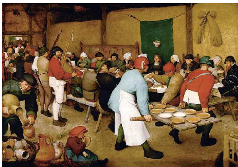
De boerenbruiloft: schilderij uit 1567 of 1568 van Pieter Bruegel de Oude.

In de middeleeuwen waren de boeren eenvoudig gekleed. De mannen droegen een rok of kiel met een tot op de enkels hangende broek en daarop een mantel zonder mouwen, een soort poncho. De vrouwen lange plooirokken, die het hele lichaam bedekten. Daaromheen droegen ze een gordel.