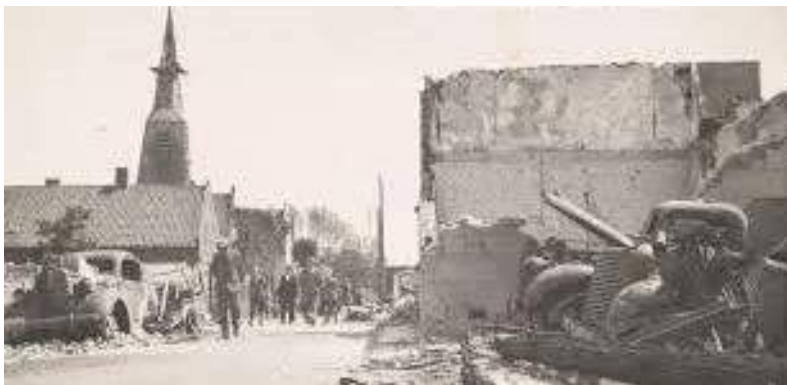
In Bleskensgraaf was er ook veel materiële schade

Veevoer en kunstmest waren nog enkele jaren op de bon. Het legertje CCD-ers, (ambtenaren van de Centrale Controle Dienst), herkenbaar aan de leren jas, was ook wel wat opgeschoond, maar ze bleven komen op de boerderij, want de regelgeving, al begonnen in de crisisjaren vóór de oorlog, en nog aangescherpt in de oorlog, zij het met het oogmerk van de voedselvoorziening, bleef de boer achtervolgen. Het zou nog erger worden, want de boer moest zorgen voor export, voor deviezen voor de wederopbouw. We groeiden naar de geleide economie. Het gehele boerengebeuren werd door de overheid begeleid.