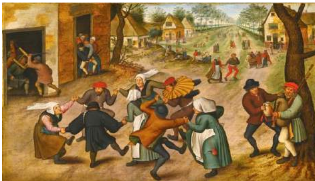
Boerendans van Pieter Breughel de Oude (midden 16 e eeuw)

sche verzorging bestond uit nabuurschap en verder was het lichaam geheel aangewezen om op eigen kracht beter te worden. Met wat geluk was er een klooster in de buurt vanwaar wat hulp kwam. Vooral de gezondheid van de boerin vormde een groot gevaar.