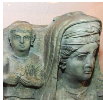
3 X DRIEDIMENSIONAAL