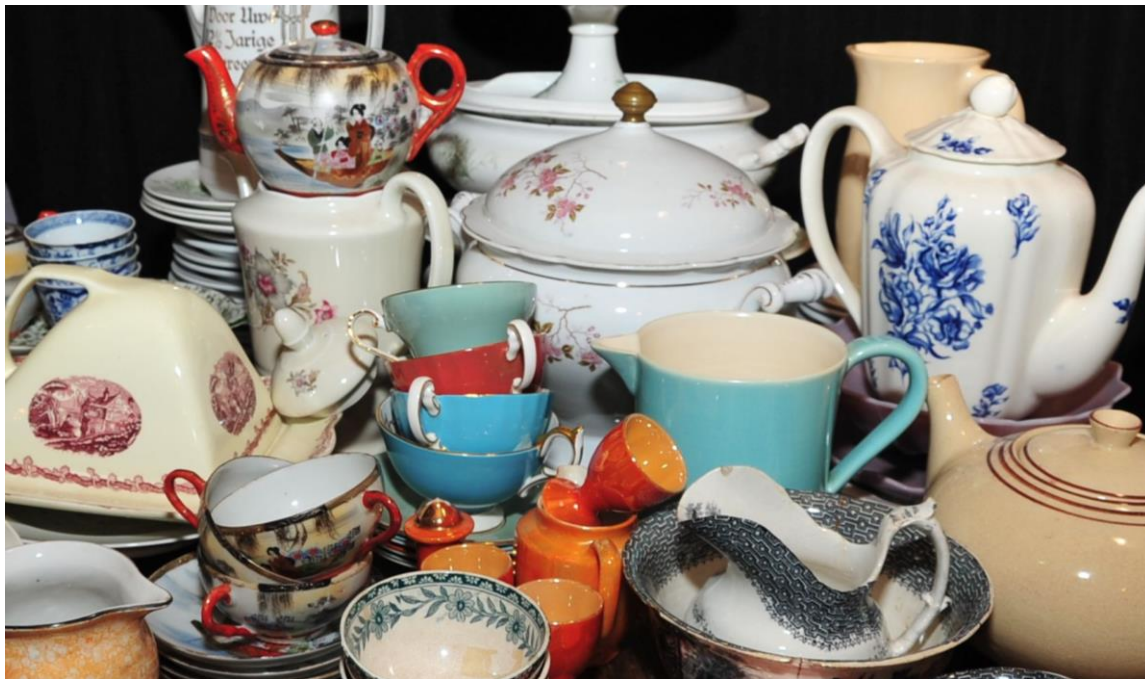
Een verzameling serviesgoed.

de lucht blijven'. Bij dit soort vergaderingen en ontmoetingen blijkt weer de heel goede band die er is. En die zich uitte in de waarderende woorden richting bestuur en directie, maar vooral ook richting de vele vrijwilligers, die De Koperen Knop met elkaar draaiende houden. En dat is geen sinecure. Als je ziet dat er na de op hoog niveau neer gezette expositie Mode in Zwart Wit ook de volgende expositie van het werk van Henk Klop van een onmiskenbaar niveau kan worden genoemd, is trots zijn op het museum en op elkaar zeker op zijn plaats.