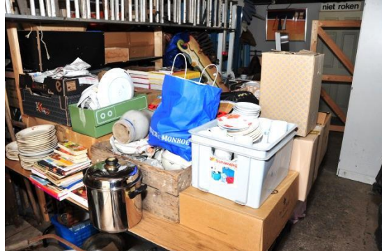
Een ongelofelijke hoeveelheid servies is ingebracht.