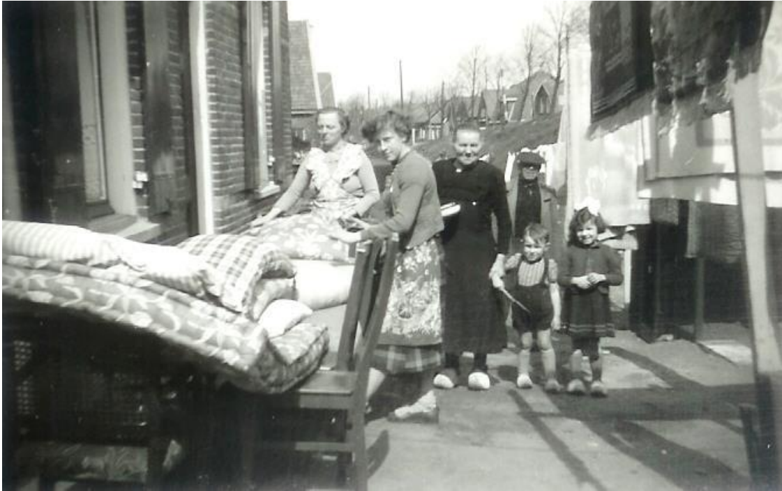
De grote schoonmaak.

Vooral als je van groter naar kleiner verhuist zal er het nodige moeten verdwijnen. Soms ook wel spullen waar je aan bent gehecht. Dat is dan moeilijk en dat maakt het verhuizen minder plezierig. Afstand doen van iets is niet altijd prettig. Afscheid nemen is dan ook onplezierig.