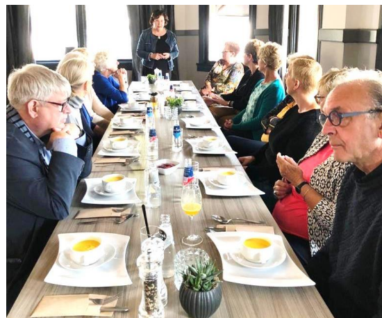
De expositiecommissie bezoekt Leerdam.