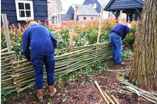
Een nieuw hord (wilgentenen schutting) in wording.