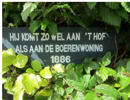
Opschriften bij een boerderij.

Als gevolg van de situering van de bewoning vooraan op de kavels zijn boerderijlinten ontstaan. Aan de randen van de waarden liggen enkele wat grotere nederzettingen. Buiten de nederzettingen is het landschap zeer open, zij het hier en daar onderbroken door oude geriefhouten eendenkooibosjes en houtsingels. Het grondgebruik is overheersend grasland. Van de 'eeuwige' strijd om de beheersing van het binnenwater getuigen boezemlanden, kaden en tiendwegen en -weteringen. In een groot deel van de Krimpenerwaard bestaan deze kenmerken tot op de huidige dag. In het zuidwesten is de mate van verandering, onder invloed van de agglomeratie Rotterdam.