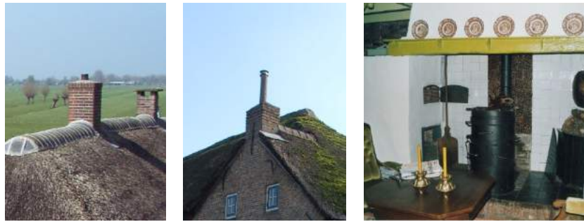
Drie schoorstenen en een schouw.

Oudere boerderijen hebben een schouw, met schoorsteen en daaronder de haard. Woorden die ons zo vanzelfsprekend in de oren klinken. Maar zijn ze zo gewoon? Formeel gezien is een schoorsteen een stenen afvoerkanaal voor rook. Maar anno nu noemen we elke rookafvoerpijp een schoorsteen, zelfs de meest eenvoudige metalen versie. Maar die laatste heet eigenlijk afvoerkanaal, waarbij je direct een vraag kunt stellen: is het toegevoegde woord kanaal hier wel juist gebruikt?