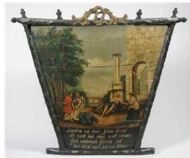
Achterkrat van boerenwagen.