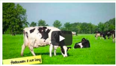
Wat doet de koe op een dag?

Ga op internet naar: vmbo.zuivelonline.nl/hoofdmenu/les1 Bekijk hier de video's: