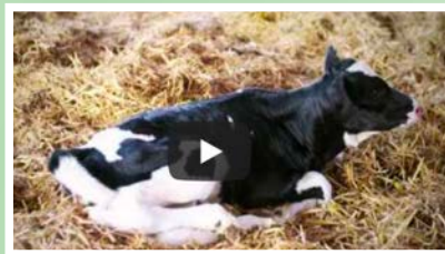
Wanneer noem je een koe een koe?