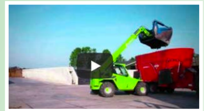
Wat heeft de koe nodig om melk te kunnen geven?