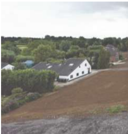
De Lekdijk bij Groot-Ammers: steunberm.

Onlangs kreeg minister-president Mark Rutte het eerste exemplaar uitgereikt van een groot formaat fotoboek over een onderwerp dat ons land al eeuwen in zijn greep heeft; al sinds de eerste bewoners hier zijn verschenen. Hier in de Alblasserwaard en de Vijfheerenlanden weten we als geen ander wat voor invloed het water heeft op het leven en op het landschap. Maar in feite geldt dit voor heel Nederland, dat voor een groot deel onder zeeniveau ligt. Er zijn weinig landen in de wereld waar het water zozeer het landschap en de nationale identiteit bepaalt als in Nederland.