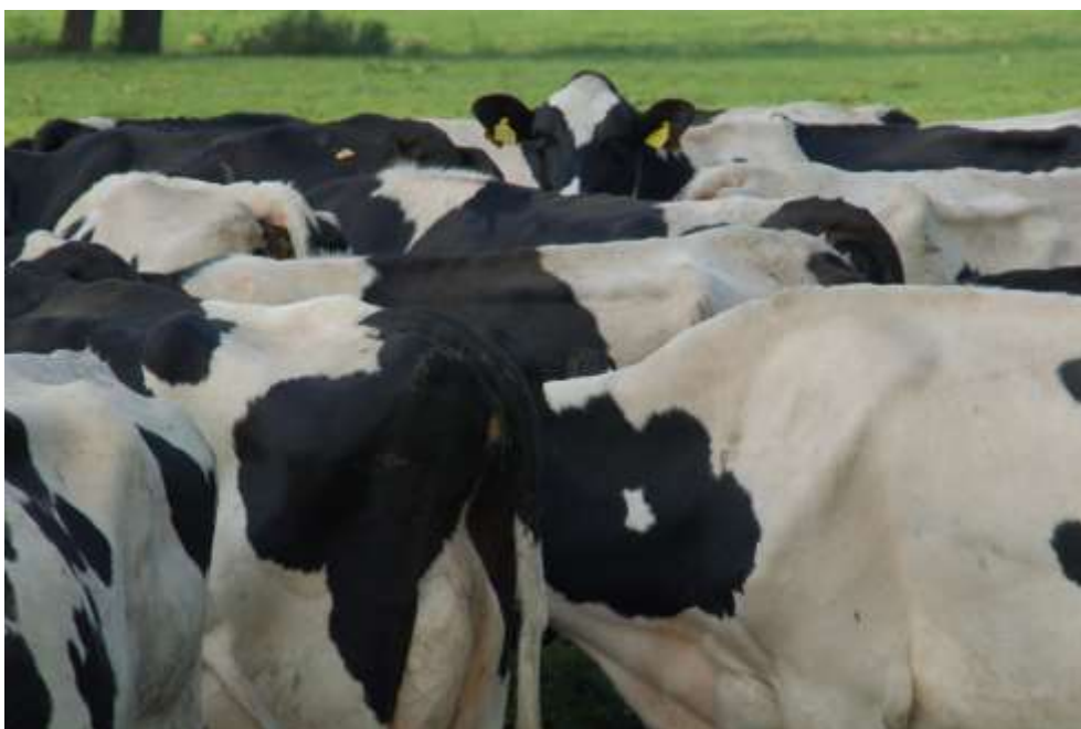
Koeienruggen (Foto: Evert van Lopik).

Maar we moeten er wel op beducht zijn dat er veranderingen op til zijn. Boerderijen krijgen een andere functie en dat zal steeds meer merkbaar zijn. De taak van Boerderij & Erf A-V wordt daardoor alleen maar belangrijker en boeiender.