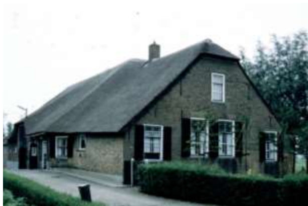
Aan de beide ramen links en rechts in de voorgevel is te zien dat dit een driebeukige (hallehuis)boerderij is. Let op de lage zijgevels en de aflopende dakvlakken.

De bekende historisch boerderijonderzoeker Klaas Uilkema schrijft er het volgende over: De boerderijen in het midden en oosten van ons land (...), Utrecht, Zuid-Holland en aangrenzende gebieden, worden tegenwoordig algemeen gerekend tot de zogenaamde hallehuisgroep. Hij schrijft ook dat het vermoedelijk pas in de middeleeuwen ontwikkelde halletype vanaf het begin een combinatie van woon-, stal- en tasfuncties was onder één dak. In zijn meest zuivere vorm wordt het hallehuis gekenmerkt door een driebeukige opzet met ankerbalkgebinten en een indeling met brede open werkvloer in de middenbeuk (middenlangsdeel) en de deeldeuren