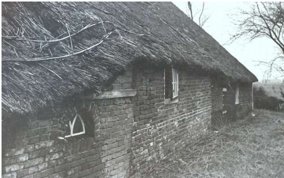
Weverwijk 18, in erbarmelijke staat...