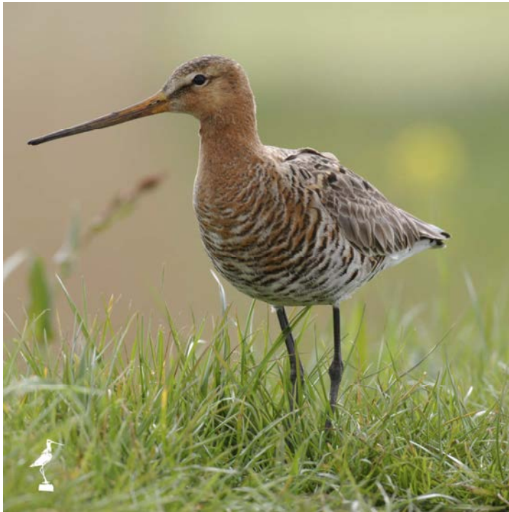
Hâneker is de streeknaam voor een mannetjes grutto

De agrarische natuur- en landschapsvereniging Den Hâneker is in 1994 opgericht als een organisatie voor het ontwikkelen van het veenweidegebied Alblasserwaard-Vijfheerenlanden. De organisatie werd gestart door betrokken agrariërs die samen met burgers uit de streek zich inzetten voor het behoud en de verbetering van natuurwaarden en het aantrekkelijker maken van het landschap.